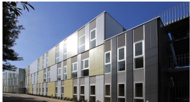
【川崎市視覚障害者情報文化センター外観】