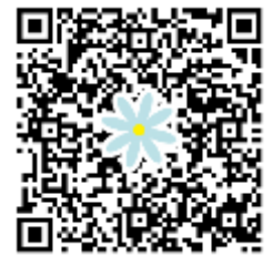
申込み用二次元コード