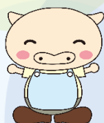
人材バンクキャラクター ほっとん

1991年生まれ神奈川県横浜市出身。 ソーシャルワーカーとして精神疾患を抱えた方の地域生活支援に携わる。 精神疾患の親をもつ子どもの会「こどもぴあ」を設立、代表を務め、当事者として体験を伝え続けている。 みんなねっと(全国精神保健福祉連合会)理事 精神保健福祉士