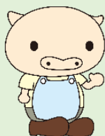
人材バンクキャラクター ほっとん

【MAIL】 jinzai-kensyu@cs-w-kawasaki.or.jp