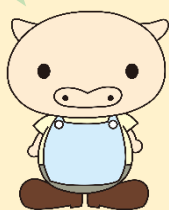
人材バンクキャラクタ ぽっとん