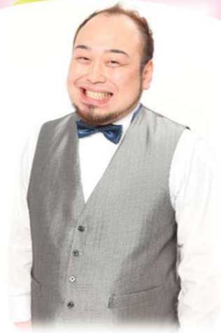
アホマイルド坂本