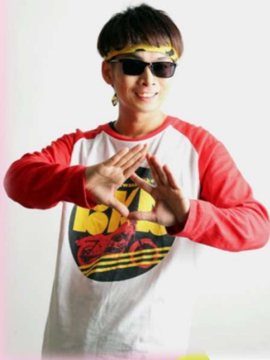
バイク川崎バイク (BKB)