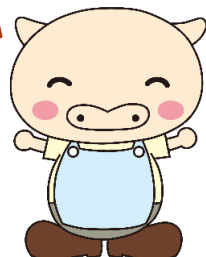
川崎市福祉人材バンク キャラクターほっとん